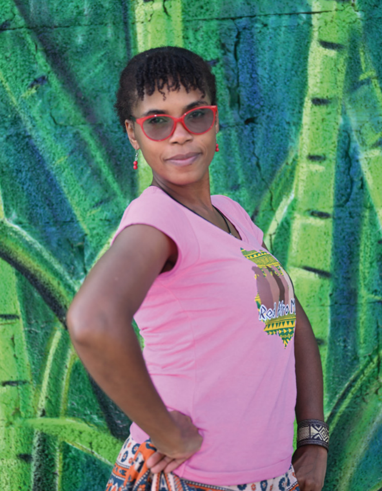
Marisol Castillo Sergio Meléndez, 2025. Fotografía digital. Paracas, Yautepec, México.